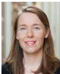
HANKE BRUINS SLOT is Tweede Kamerlid en namens het CDA woordvoerder voor de zorg. Haar belangrijkste speerpunten zijn minder regels in de zorg, minder macht voor de zorgverzekeraar en preventie.