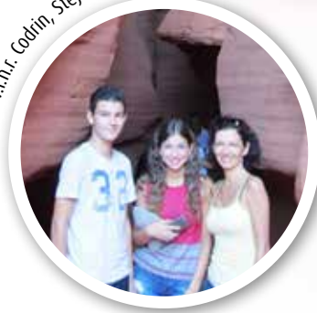
V.l.n.r. Codrin, Stejara en Romana.

Na de bekende eerste vraag, volgt meestal gelijk de tweede: 'Geneeskunde, én het